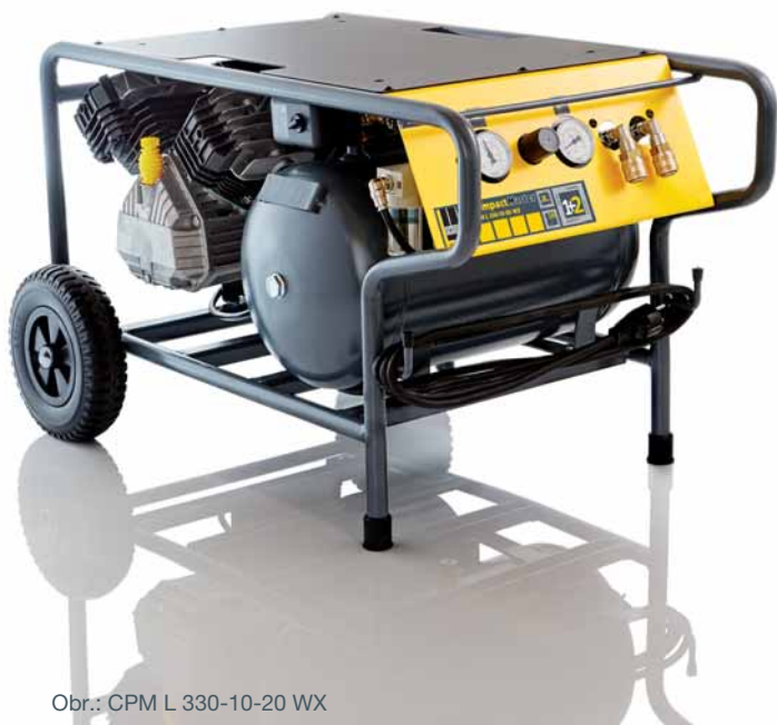
Obr.: CPM L 330-10-20 WX